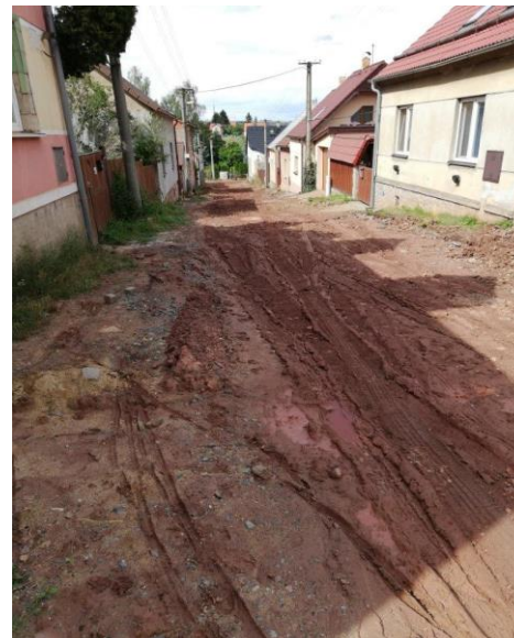
Pokračování na str.2